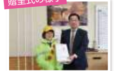
令和5年3月八頭町立八東小学校

当協会では、毎年、県内の新入学児童に対して交通安全の大切さを理解してもらうため、交通安全啓発グッズを贈呈しています。