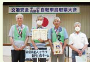
(高齢者大会準優勝の美保南老人クラブ新生会チーム)