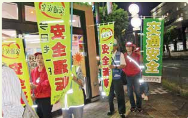
女性部を中心に行った反射材着用啓発

交通安全協会では、地域から交通事故をなくすための幅広い活動を行っています。 あなたの協力費で交通安全活動が展開されています。