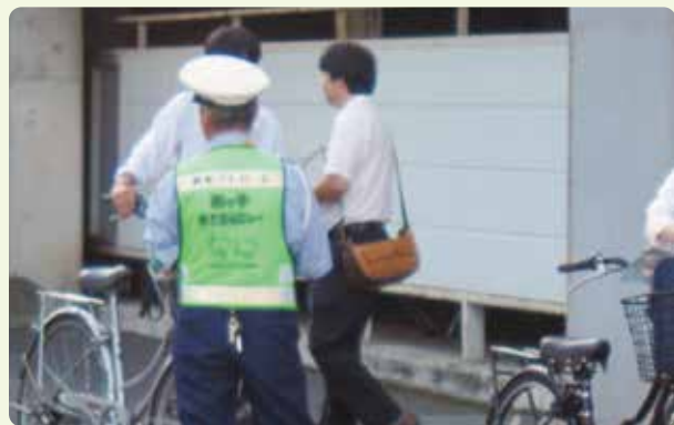
ヘルメット着用広報