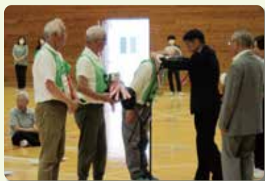
(高齢者大会3連覇の中ノ郷チーム)