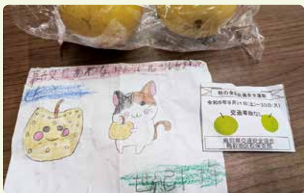
支部による交通安全広報(交通事故「なし」の配布)