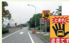
逆走の注意喚起標識 (サービスエリアの流入ランプ)