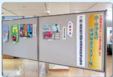
交通安全ポスター展示