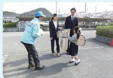
入学おめでとう広報