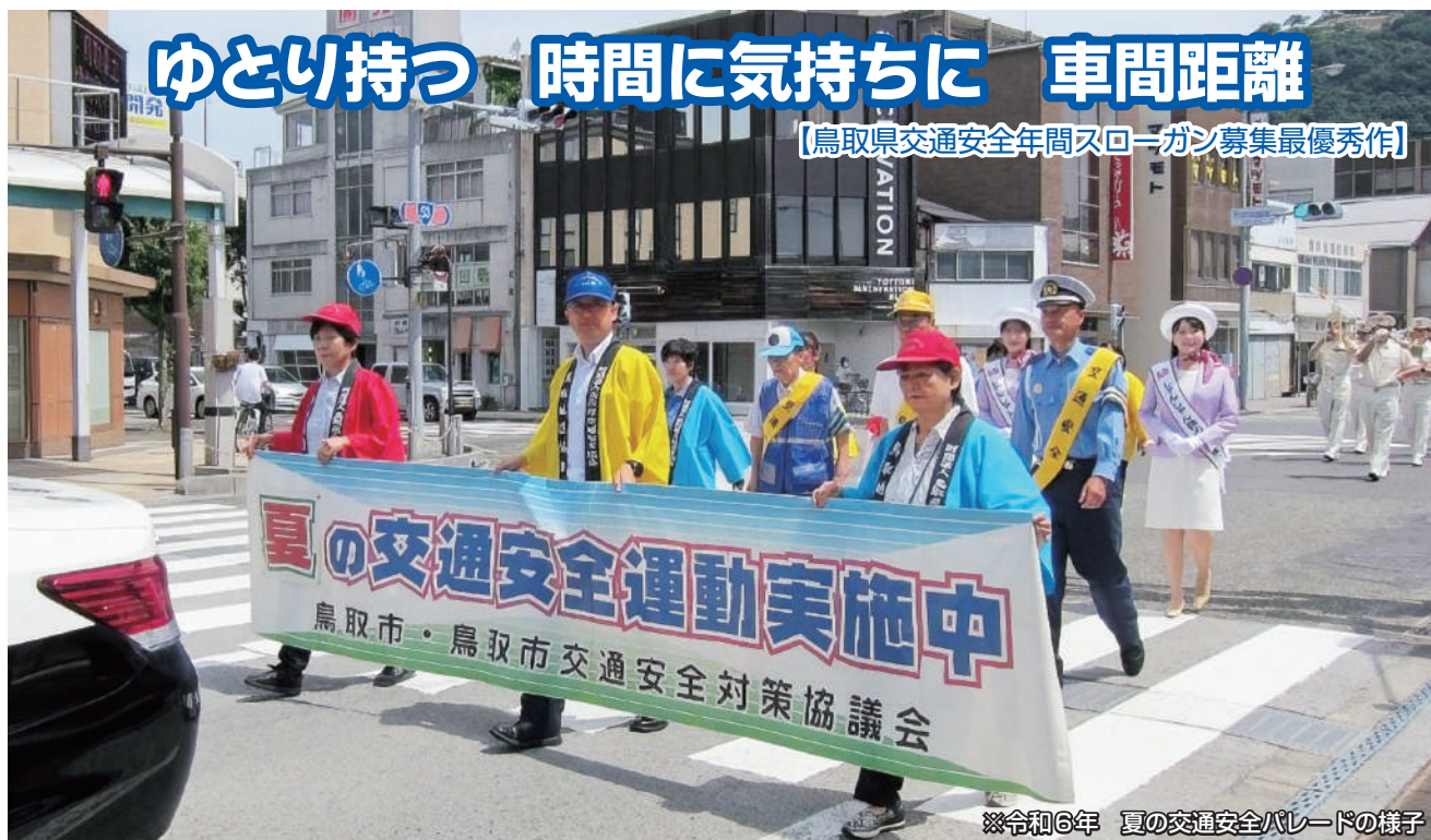
※令和6年 夏の交通安全パレードの様子