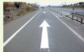
進行方向を明示するための 路面標示(本線への合流部)