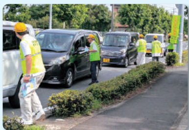
支部による交通安全広報