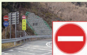
「この先進入禁止」の標識 (本線から一般道への流出ランプ)