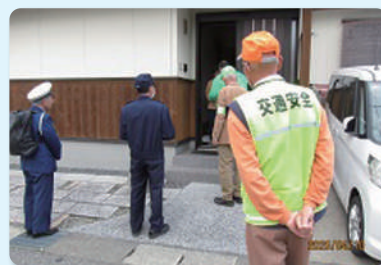
高齢者宅訪問指導