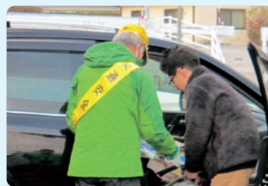
チャイルドシート使用広報