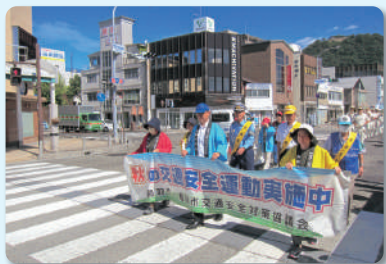
交通安全パレード

交通安全協会では、地域から交通事故をなくすための幅広い活動を行っております。 あなたの協力費で交通安全活動が展開されています。