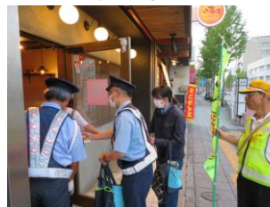
飲酒運転根絶広報 (東町)