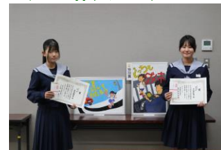
ポスターコンクール入賞 (福米中学校)