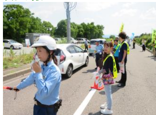
広報検問(大篠津町)