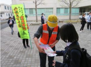
自転車マナーアップ広報 (米子北斗高校)