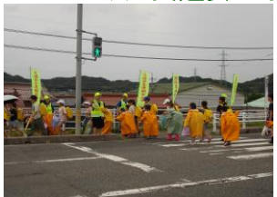
保護誘導活動(新青木橋)