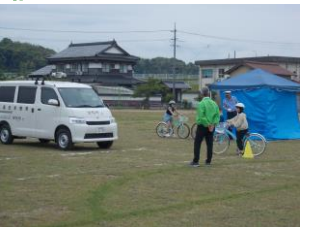
自転車教室 (尚徳小学校)