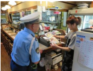
飲酒運転根絶広報 (角盤町)