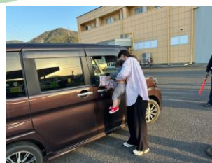
交通安全キャンペーン広報 (南部町阿賀)