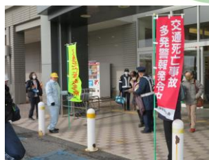
死亡事故に伴う緊急広報 (イオン日吉津店)