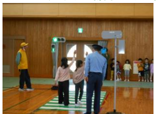
交通安全教室 (箕蚊屋小学校)