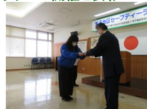
セーフティーラリー表彰式