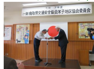
優良運転者等表彰式