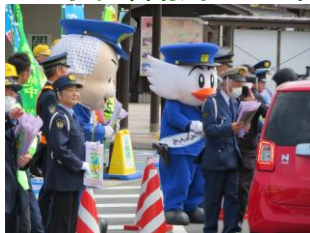
安来との合同広報検問 (道の駅あらエッサ)