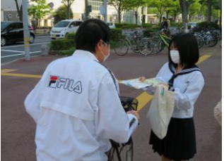
高校生による自転車利用 広報(イオン米子駅前店)